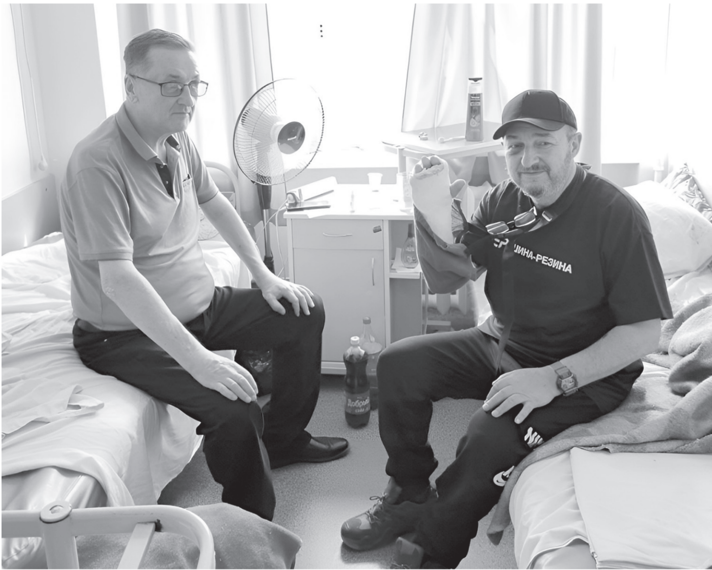
Сотрудники республиканского Центра социального обслуживания оказывают всестороннюю поддержку раненым бойцам

Суммарные расходы республиканского бюджета на осуществление всех региональных выплат участникам специальной военной операции и членам их семей составили более 4,5 миллиарда рублей, в том числе в текущем году — более 2,5 миллиарда рублей. За это время ор-