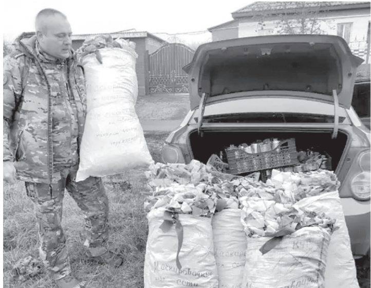
Идет погрузка партии гуманитарной помощи